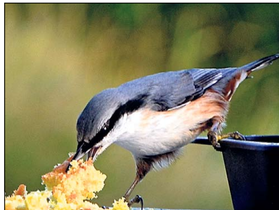
Spettmeisen er litt glupsk på kakefatet.

DAGENS OABILDE legg inn bilder på: http://dagensoabilde.origo.no/