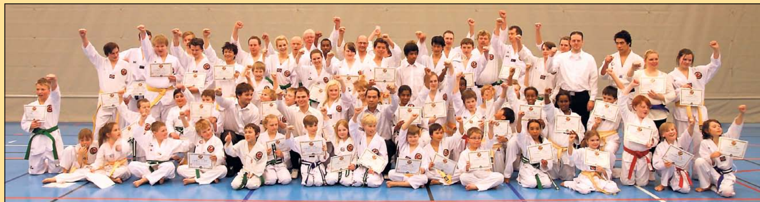
KLARTE GRADERINGEN: Her er alle i gruppene junior og ungdom/voksen samlet på ett Brett – med beviset på at de klarte graderingen.