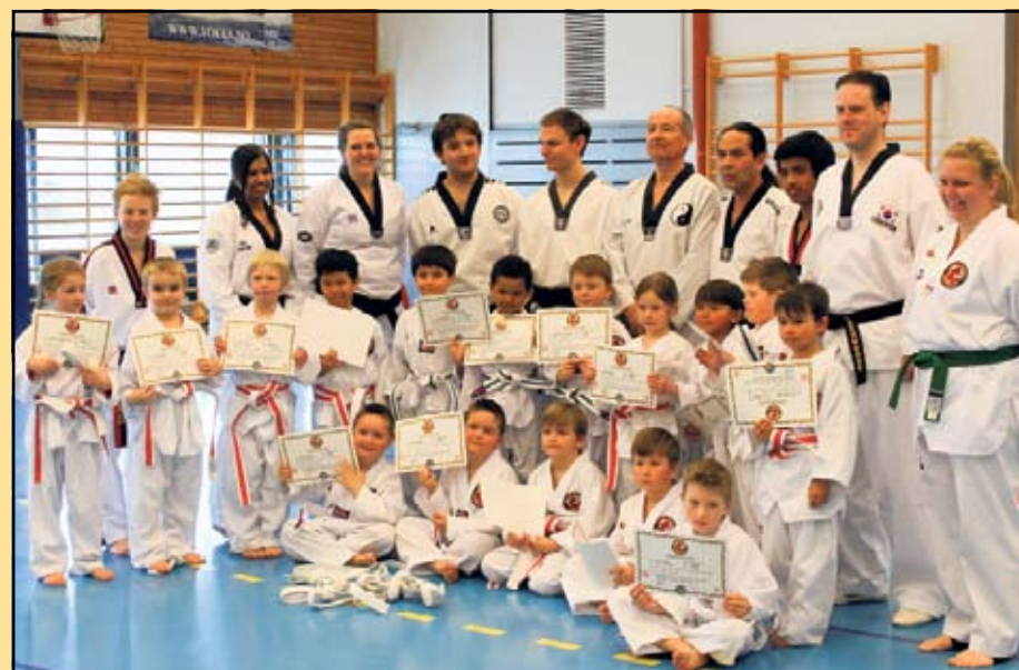
STOLTE: De aller yngste – Ulvene – poserer etter endt gradering.