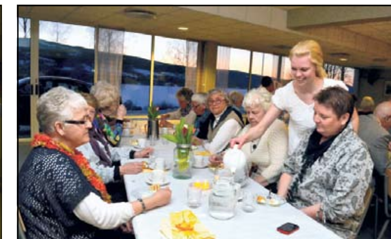
SMAKFULL PÅSKETALLERKEN: De eldre satte stor pris på maten som elevene på restaurant og matfaglinja hadde laget.